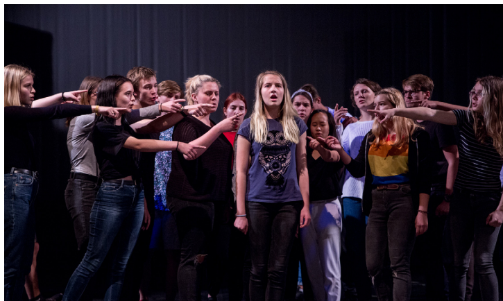
Musiktheater von Jugendlichen im Rahmen des Projektes »Welche Welt?«

Alle Teilnehmer der Sommerakademie erhalten ein Vollstipendium für Kursgebühren, Unterkunft und Verpflegung. Finanziert durch Fördermittel des Bundesministeriums für Familie, Senioren, Frauen und Jugend.